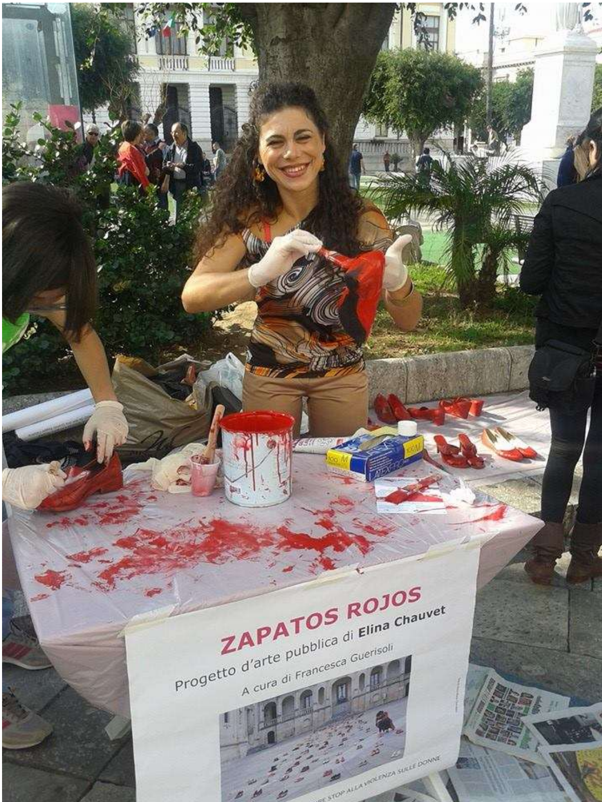
EVENTO DI PIAZZA DI SENSIBILIZZAZIONE- REGGIO CALABRIA