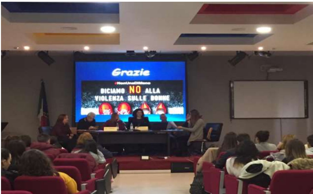
SEMINARIO INFORMATIVO VIBO VALENTIA – LICEO CAPIALBI (VV)