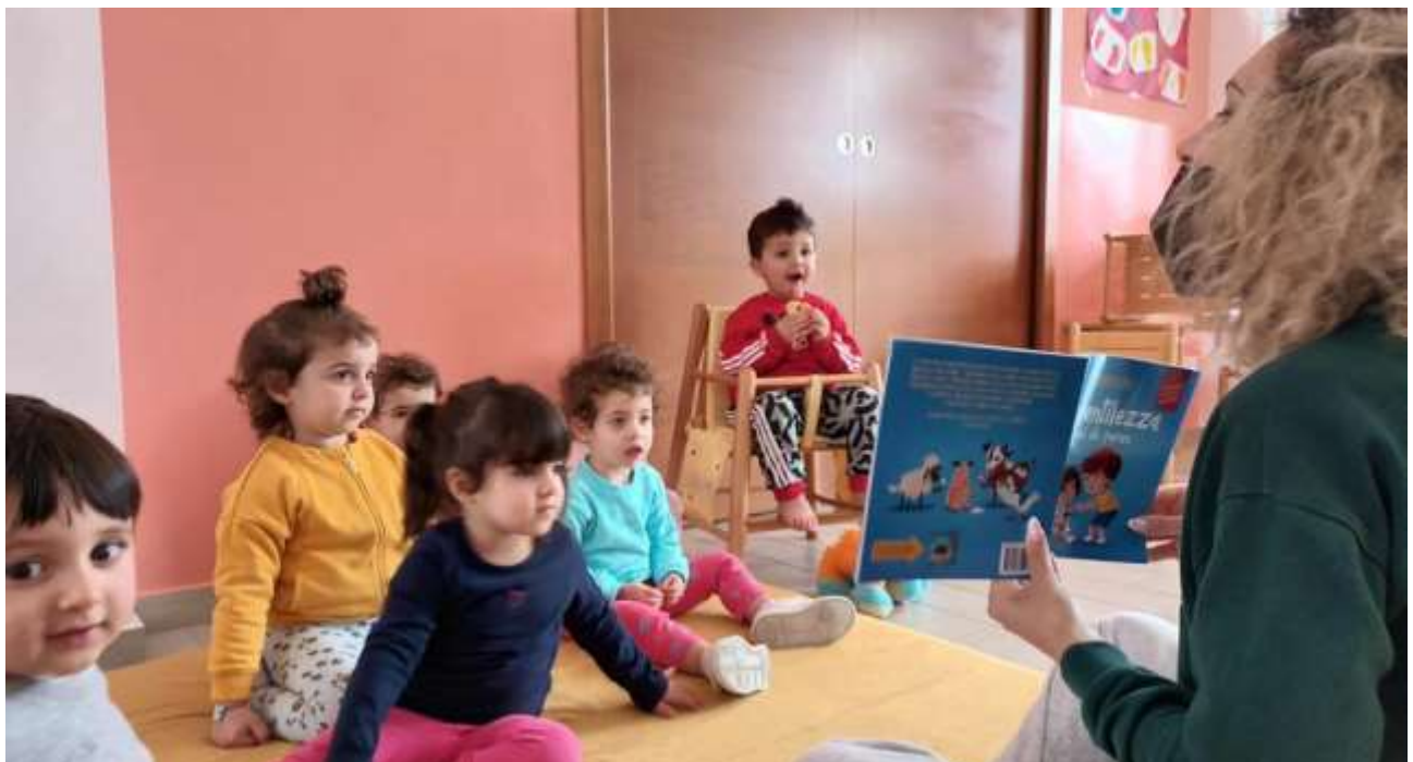
ANIMAZIONE VERSO MINORI