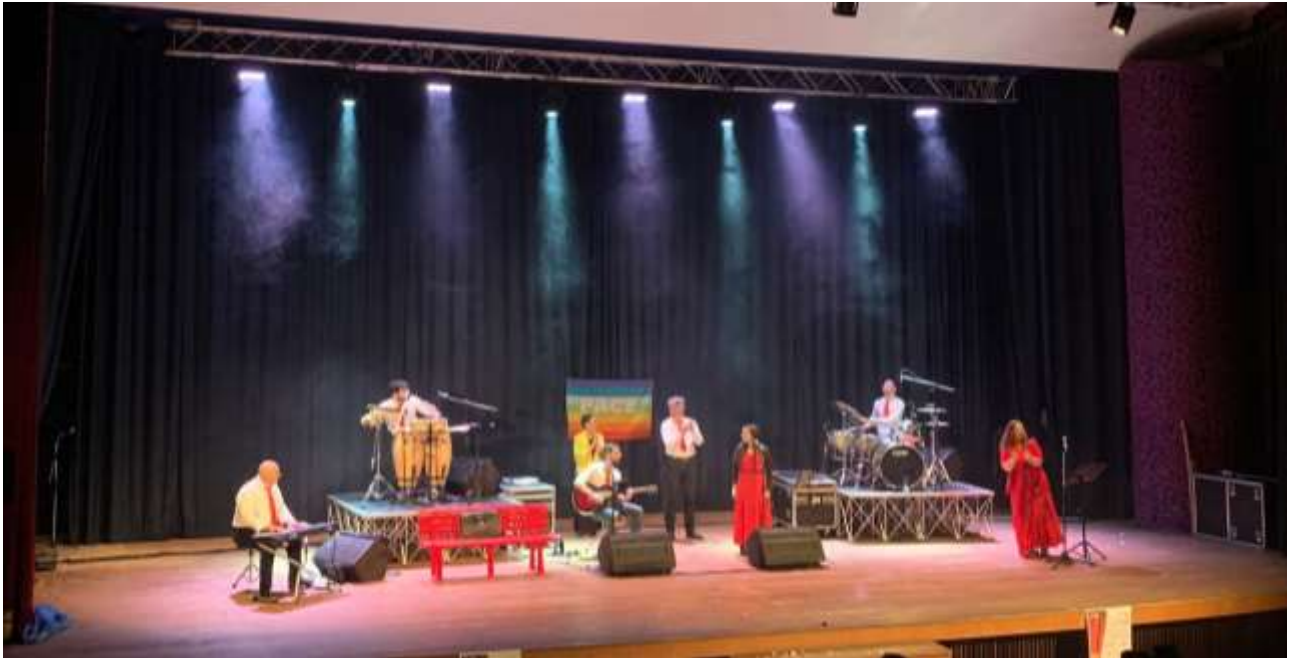
CAMPAGNA ANTIVIOLENZA CON MANIFESTAZIONE TEATRALE- MARINELLA E CALABRISSELLA