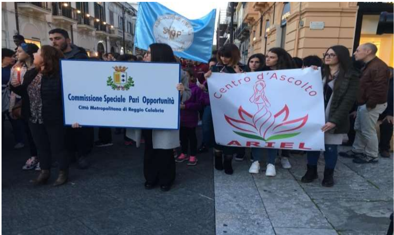
FIACCOLATA DI SENSIBILIZZAZIONE- REGGIO CALABRIA