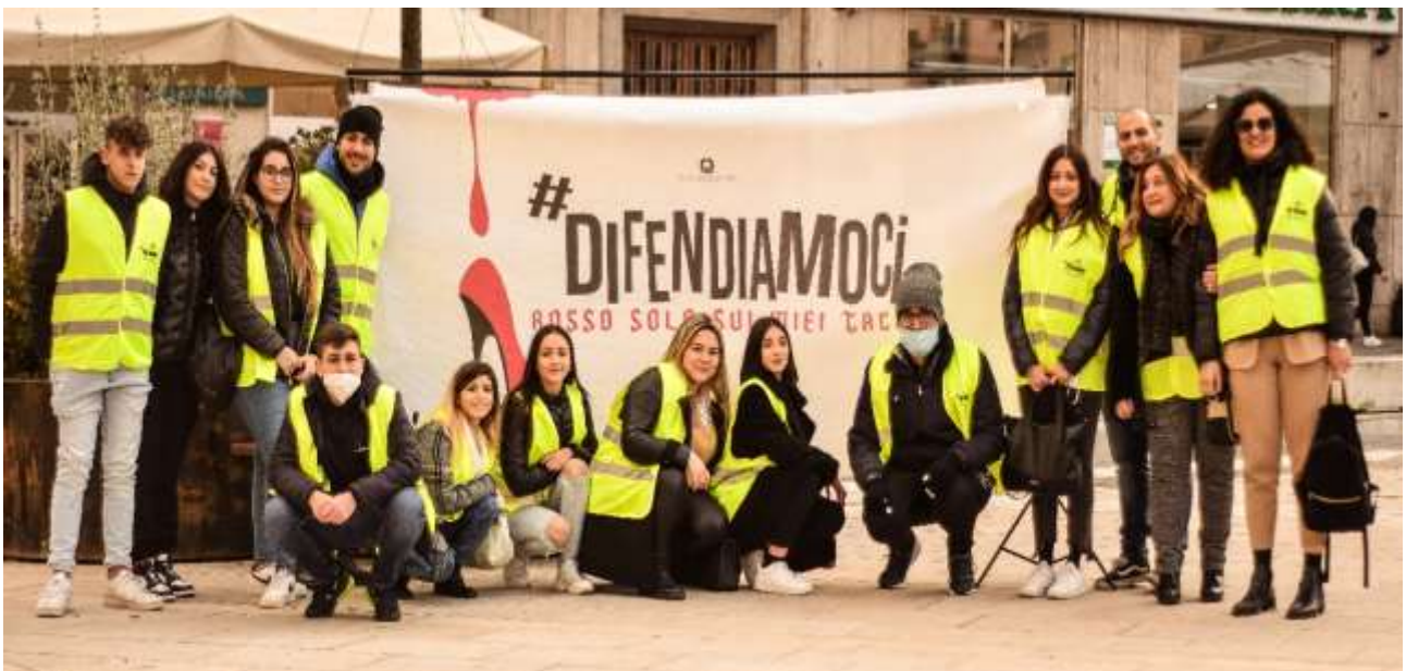
VIAGGIO- CAMPAGNA ANTIVIOLENZA CON MANIFESTAZIONE TEATRALE – COSENZA 2023