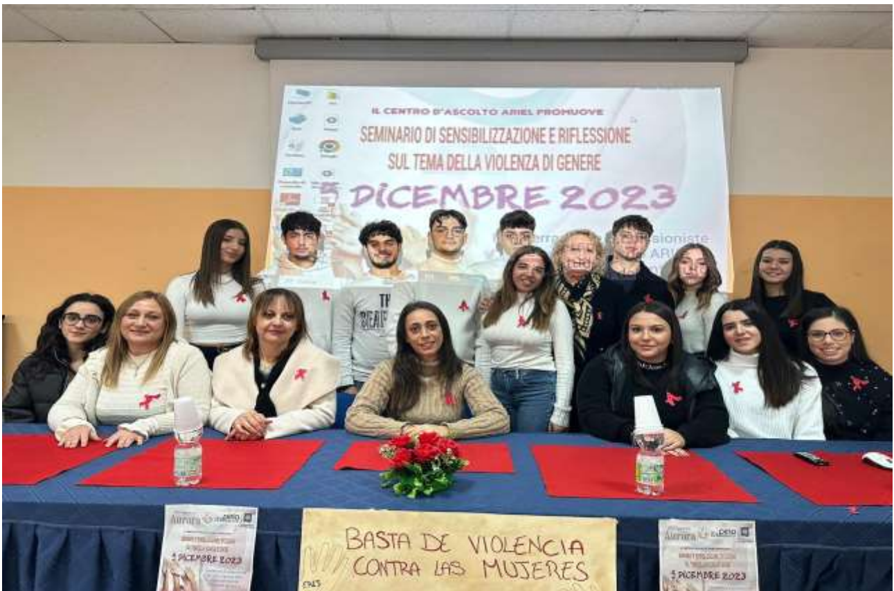
SEMINARIO DI SENSIBILIZZAZIONE ISTITUTO SCOLASTICO - 2024