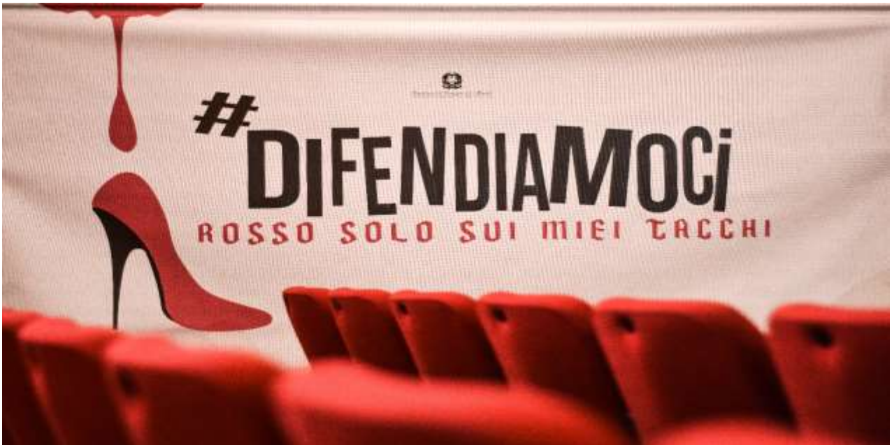
CAMPAGNA ANTI-VIOLENZA CON MANIFESTAZIONE TEATRALE