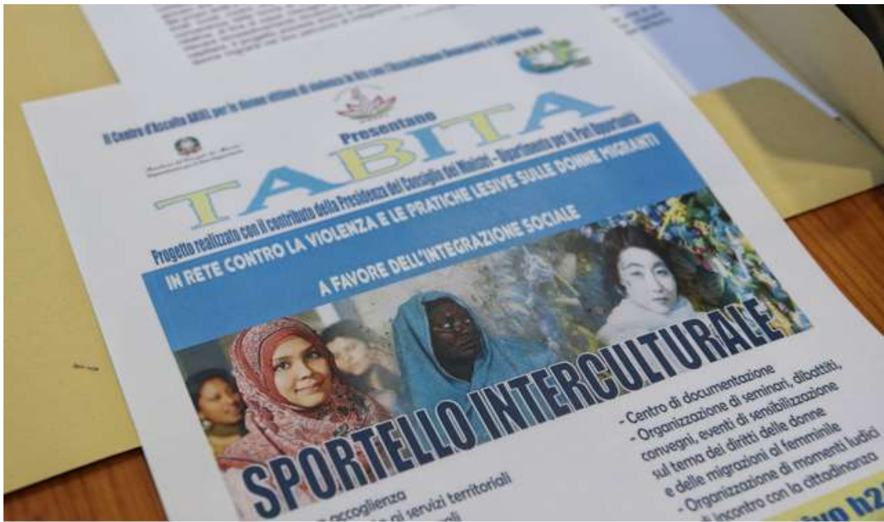
INAUGURAZIONE SPORTELLO INTERCULTURALE TABITA