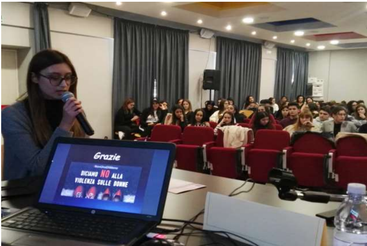
SEMINARIO INFORMATIVO NELLE SCUOLE