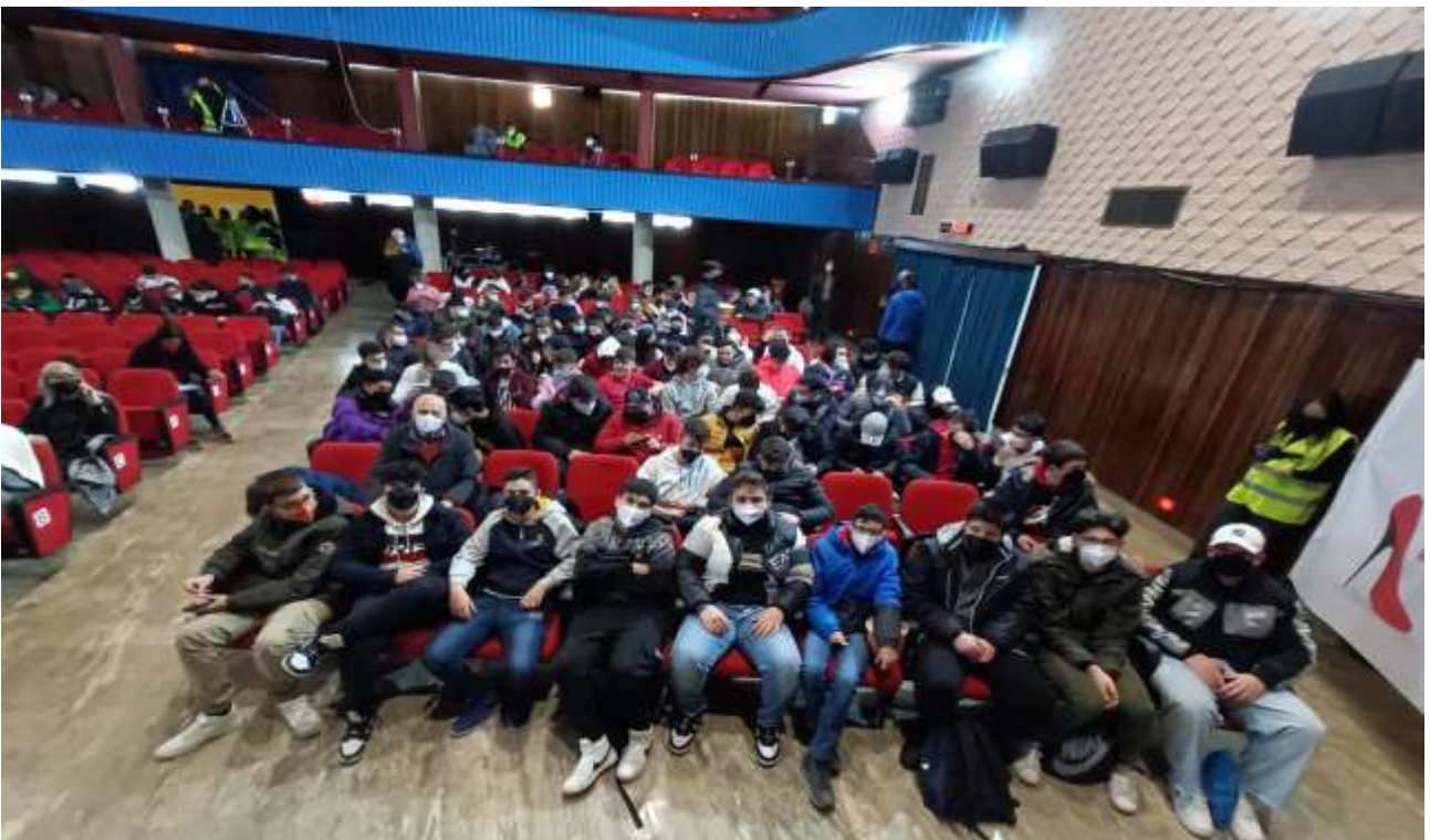
VIAGGIO - CAMPAGNA ANTIVIOLENZA CON RASSEGNA TEATRALE- RENDE 2023