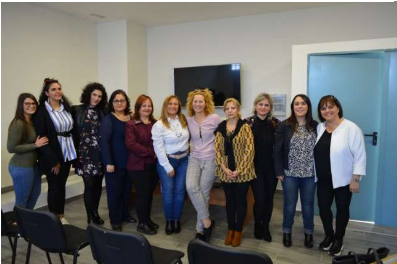
PROFESSIONISTE DELLO SPORTELLO INTERCULTURALE TABITA