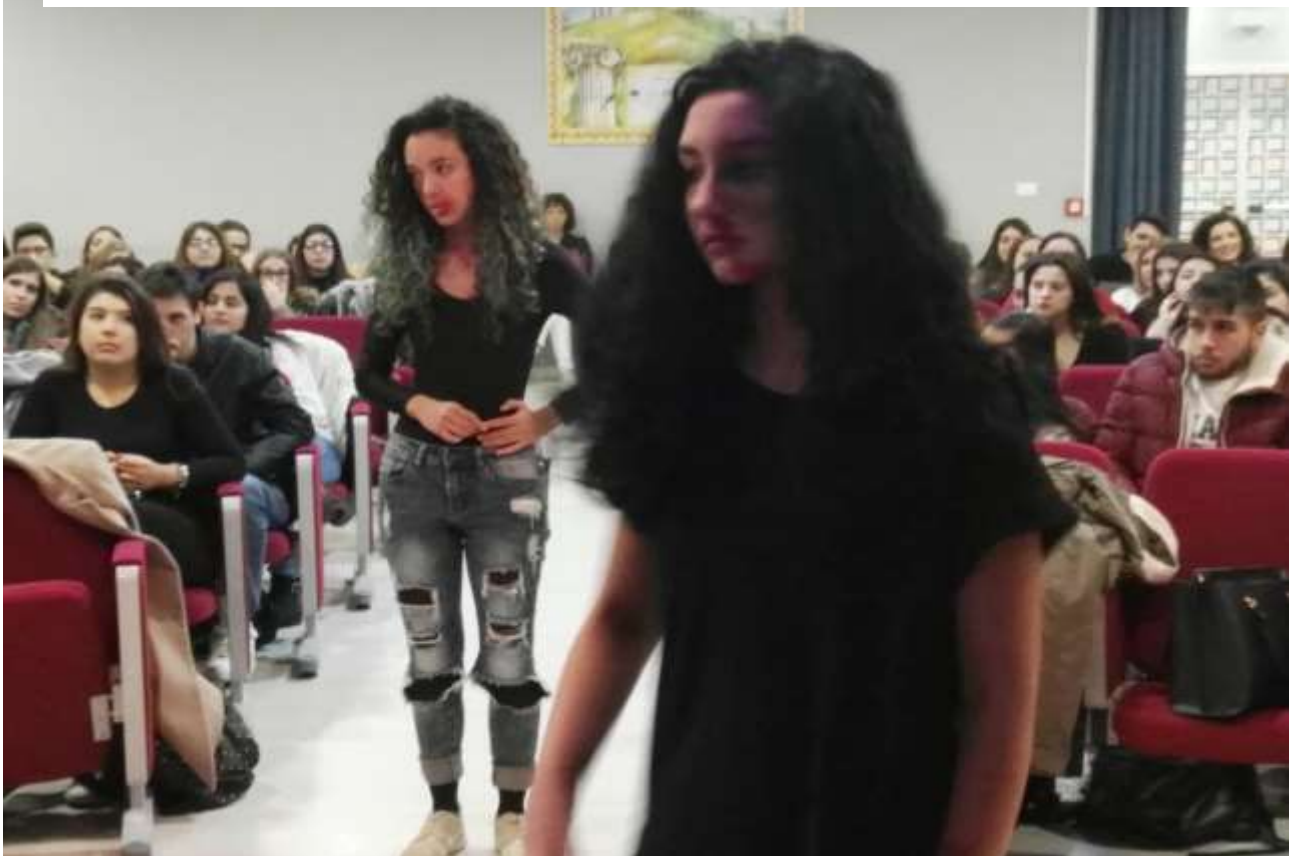
ATTIVITA' DA PARTE DEGLI STUDENTI DURANTE SEMINARIO PROGETTO ALBA – VIBO VALENTIA