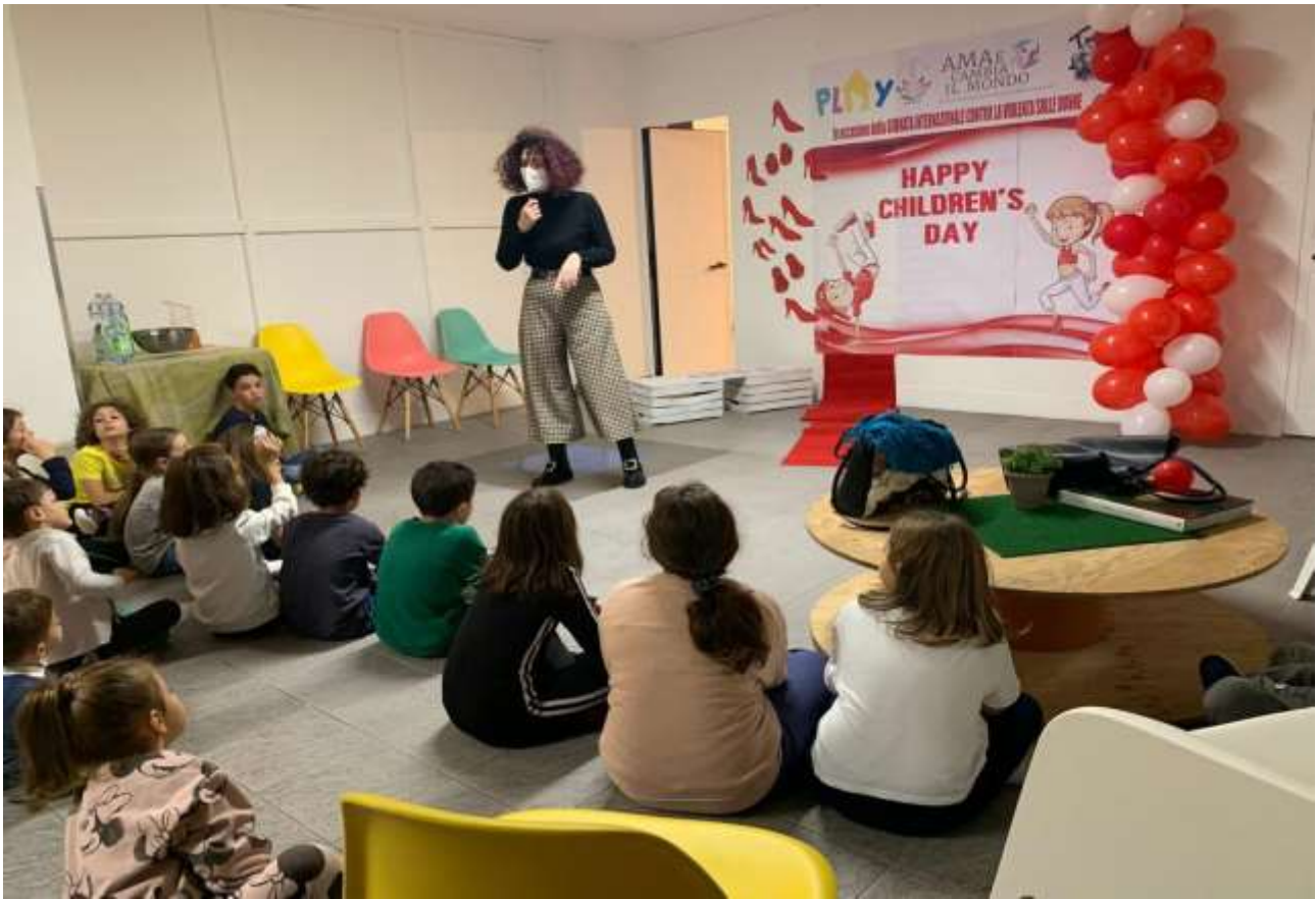
ANIMAZIONE VERSO MINORI