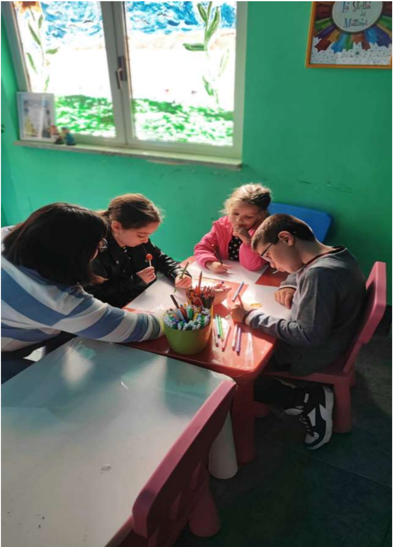
ATTIVITA' POMERIDIANE DI SOSTEGNO AI MINORI